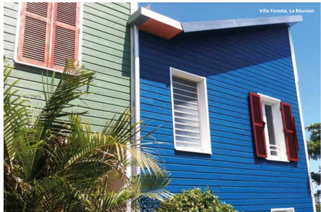
Villa Foresta, La Réunion