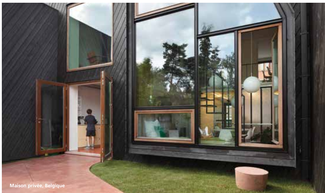
Maison privée, Belgique