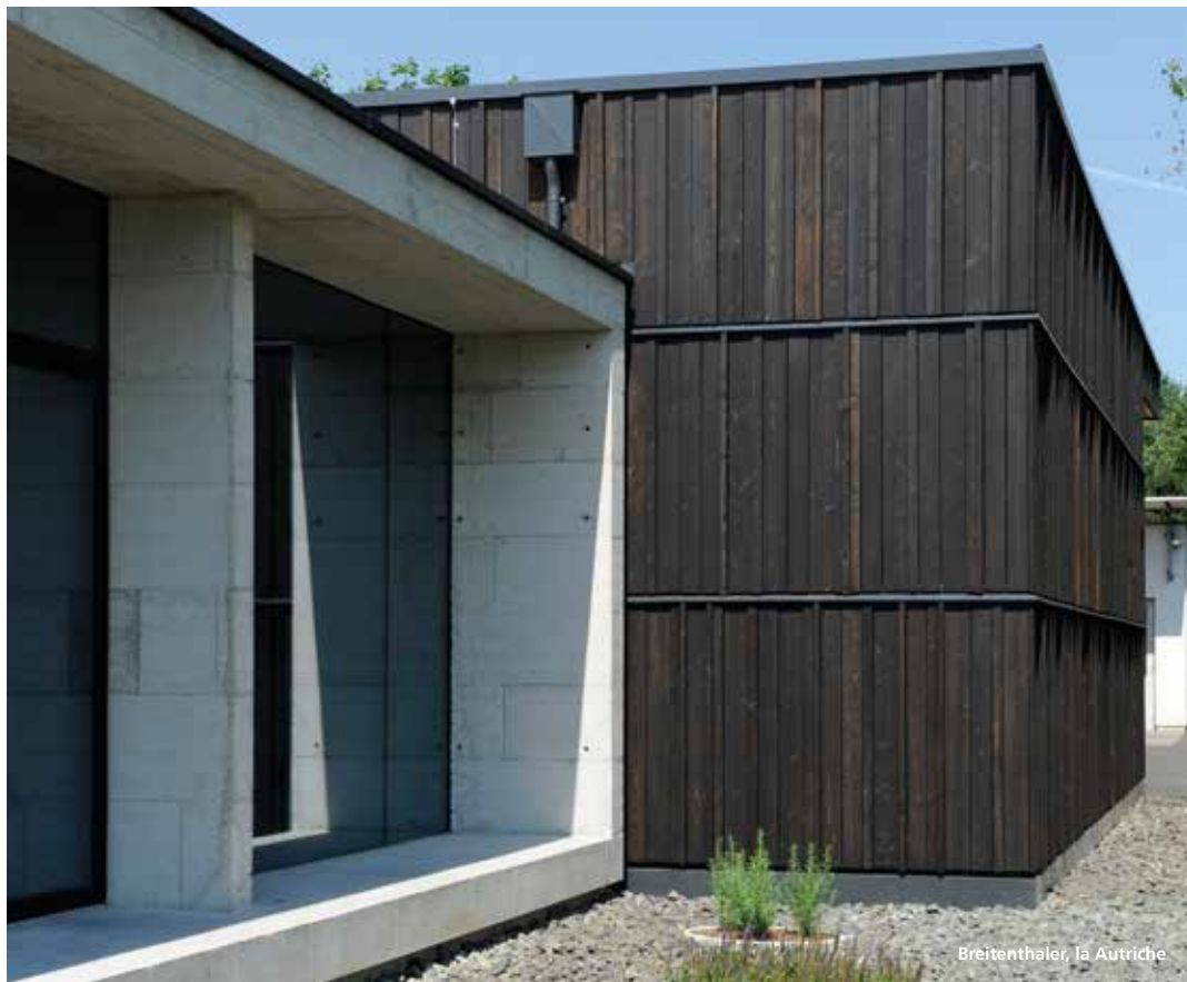
Breitenthaler, la Autriche