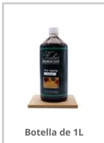
Botella de 1L