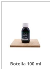
Botella 100 ml