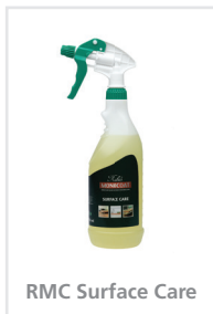
RMC Surface Care

Læs mere på emballagen og sikkerhedsdatabladet.