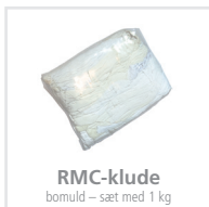
RMC-klude bomuld – sæt med 1 kg